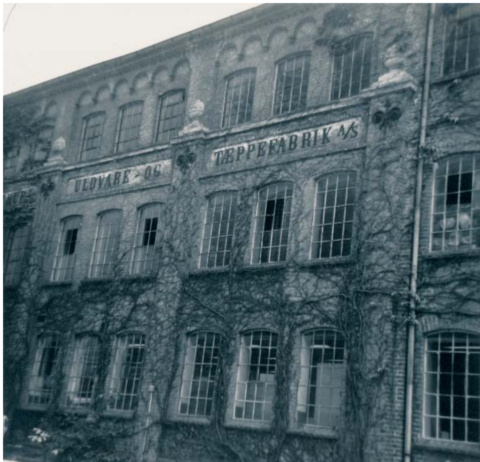
Wittrups Tæppefabrik

Der skulle imidlertid gå yderligere 10 år inden der rigtig skete mere. De inden krigen indsamlede midler foreslog hverken helt eller halvt, så i 1952 blev planerne ændret i retning af at man ville indrette en hjælpekirkegård i Grejsdalen og i den forbindelse også bygge et kapel.