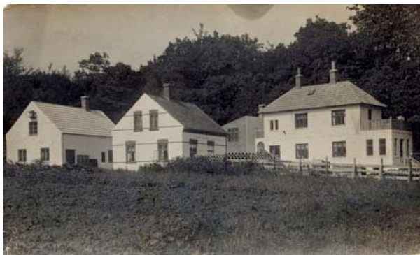
Kirken kom til at ligge bag huset længst til højre

bakke, og hvor dalens beboere hvert år samledes omkring midsommerbålet.